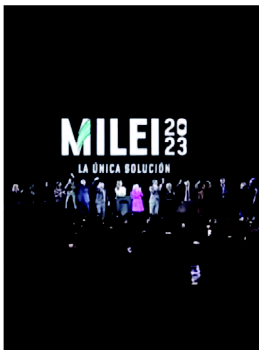
FIGURA 5 Logotipo Milei. Cierre de campaña PASO