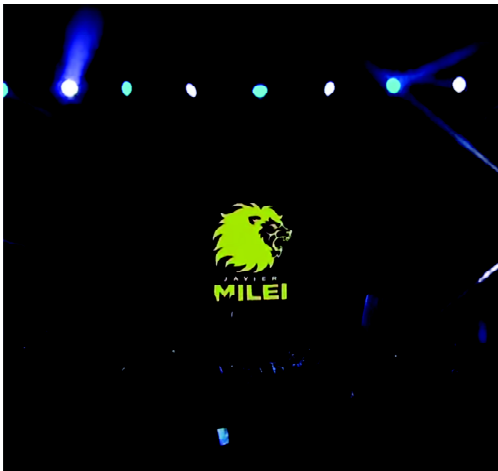
FIGURA 2 Isologo Milei. Cierre de campaña PASO