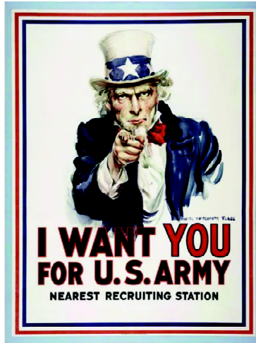
FIGURA 3 Propaganda de reclutamiento, Estados Unidos (1917)