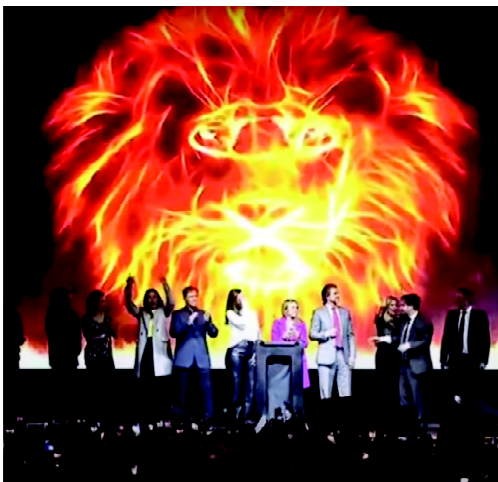
FIGURA 1 León en llamas. Cierre de campaña PASO